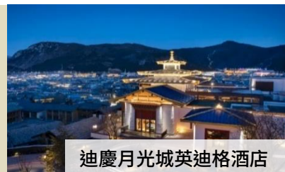
迪慶月光城英迪格酒店