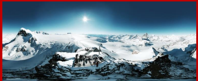
馬特洪峰冰川天堂