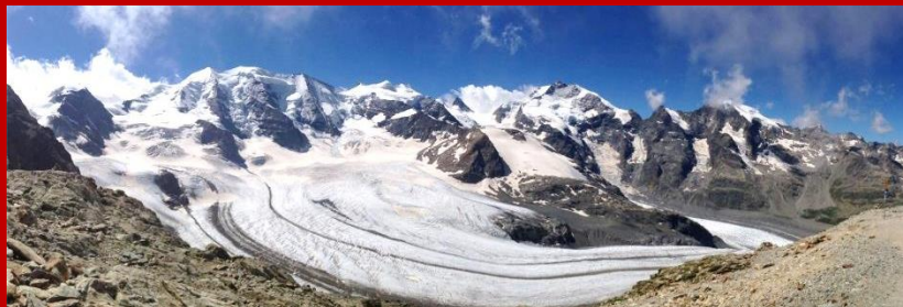
女魔峰眺望莫爾特拉奇冰河