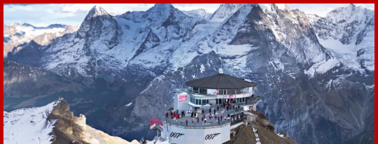
著名電影 007 鐵金剛的拍攝地 - 雪朗峰