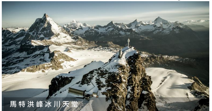
馬特洪峰冰川天堂

❄️ 馬特洪峰冰川天堂 ：搭乘空中纜車前往富麗 Furi，換乘大型纜車前往特勞克納施泰格(Trockener Steg)，向馬特洪峰冰川天堂觀景台邁進；群山俊嶺、壯麗冰河以及連綿的皚皚白雪。在冰川天堂，除可欣賞到馬特洪峰美麗的一面，還有機會觀賞策瑪特地區 38 座海拔 4,000 米以上的雄峰，亦可在冰川源頭進行短暫的步行。(註：是日如遇天氣問題，或其他原因引致纜車停駛，冰川天堂行程則改為前往葛拉特大雪山 Gornergrat。)