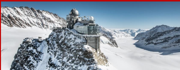
歐洲屋脊 - 少女峰