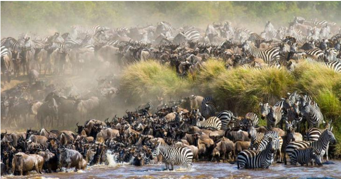
↔: Ashnil Mara Tented Camp 豪華帳篷營地酒店 或同級

🦏瑪賽瑪拉野生動物保護區： 隨著專業嚮導司機乘車深入動物保護區，展開《遊獵巡蹤》，用鏡頭獵取野生動物悠遊於大草原的畫面；除了非洲 Big Five 外，更可一睹河馬、斑馬、獵豹、葛氏瞪羚、東非黑面狓羚、柯氏狓羚、飛羚、鱷魚、長頸鹿等。動物保護區佔地極大，遊獵巡蹤路線多不勝數，連國家地理頻道亦每年到此拍攝野生動物生態。安排充裕時間追蹤各種珍貴野獸的生活動態。