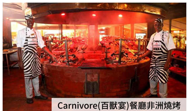
Carnivore(百獸宴)餐廳非洲燒烤