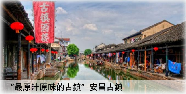
“最原汁原味的古鎮” 安昌古鎮

紹興 已有 2500 多年建城史，首批國家歷史文化名城、聯合國人居獎城市，也是著名的水鄉、橋鄉、酒鄉、書法之鄉、名士之鄉。紹興素稱“文物之邦、魚米之鄉”。著名的文化古跡有蘭亭、禹陵、魯迅故里、沈園、王羲之故居、蔡元培故居、周恩來祖居、秋瑾故居等。