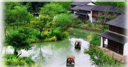
“中國首座濕地公園” 西溪