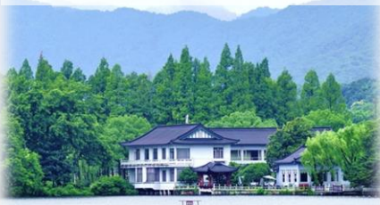
“西湖里的西湖” 西湖國賓館