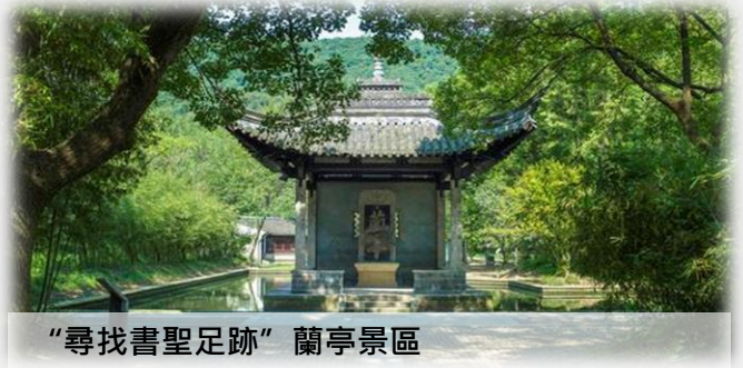
“尋找書聖足跡” 蘭亭景區