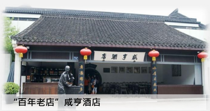
“百年老店” 咸亨酒店