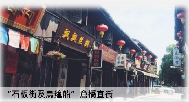
“石板街及烏篷船” 倉橋直街