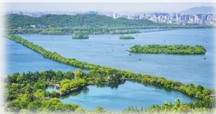
“西湖美景集中地” 蘇堤