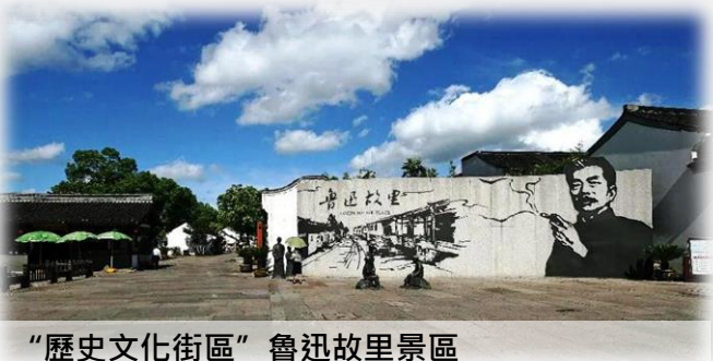
“歷史文化街區” 魯迅故里景區