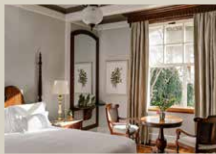
伊瓜蘇瀑布公園入住園內唯一 5 星級 Das Cataratas, A Belmond Hotel