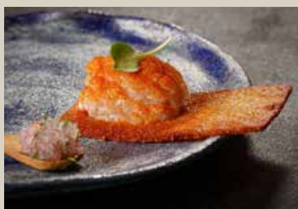
拉丁美洲 50 佳餐廳