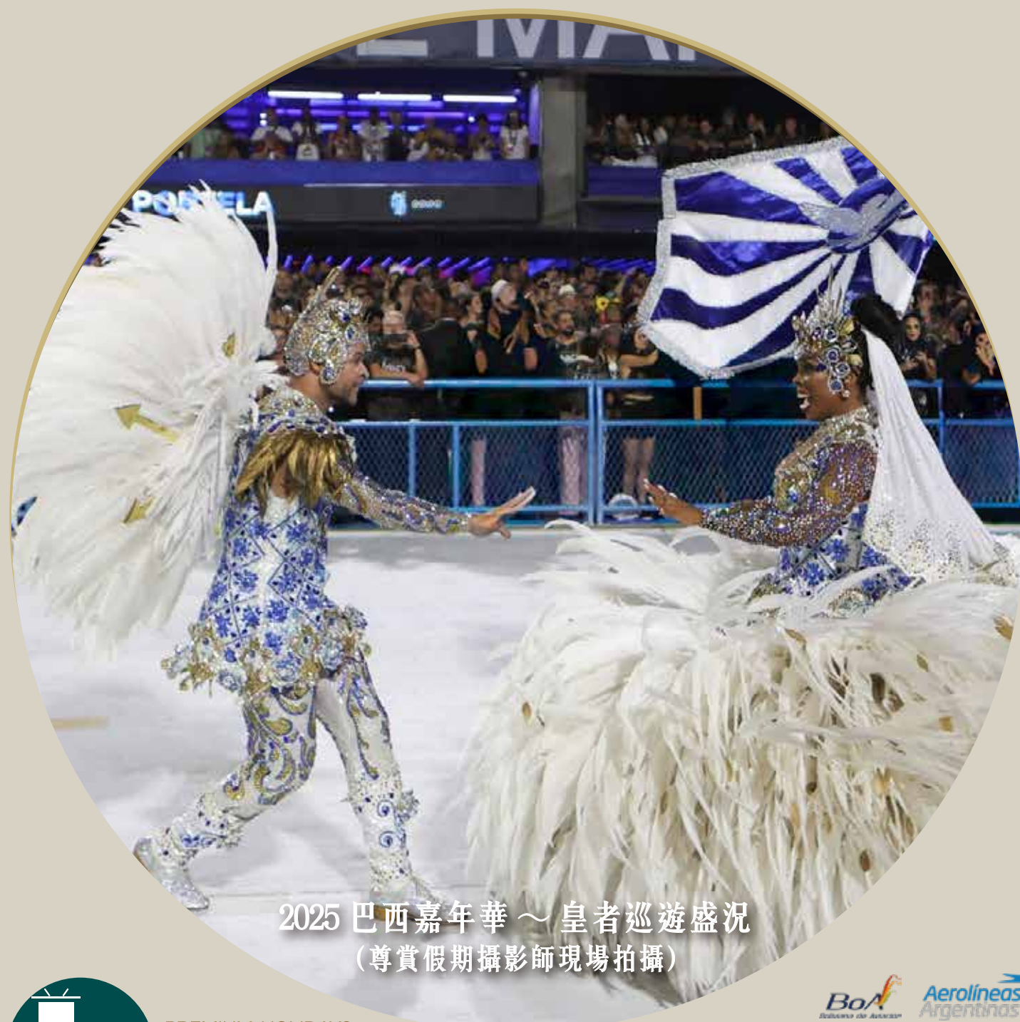
2025 巴西嘉年華～皇者巡遊盛況 (尊賞假期攝影師現場拍攝)