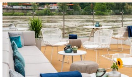
“River Terrace” 露天休息室