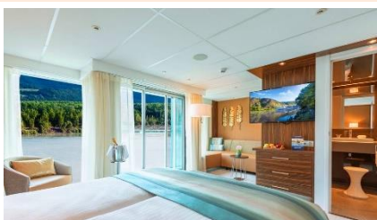
Amadeus Suite(約 284sq.ft) 套房~連外部陽台 with walk-out exterior balcony