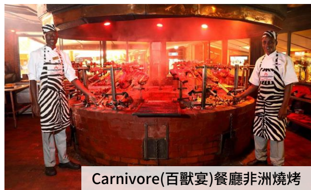
Carnivore(百獸宴)餐廳非洲燒烤