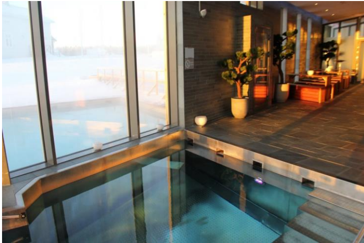
📍: Cape East - Hotel & SPA 酒店或同級