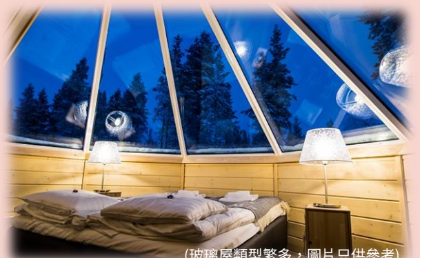
(玻璃屋類型繁多，圖片只供參考)