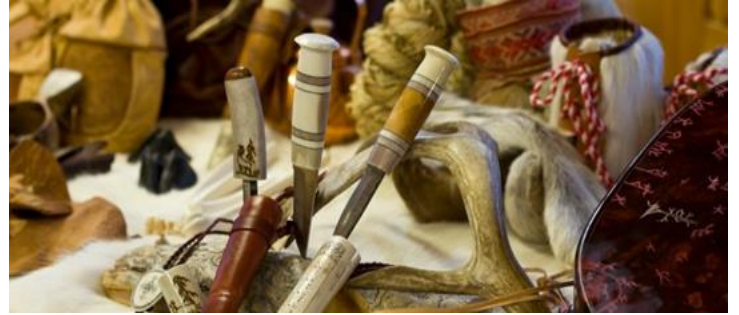
📍: 5 星級 Haven 酒店或同級

📍鹿角工作坊：馴鹿與芬蘭人息息相關，除了是交通工具及食材，甚至連自然脫落的鹿角也可製成裝備或手工藝品。前往鹿角工作坊，理解如何利用拉普蘭傳統方式，使用鹿角及其他天然物料製作小飾物，製作期間可享用飲料及小吃。