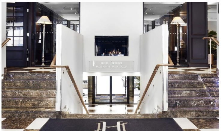
↔: 5 星級 Haven 酒店或同級