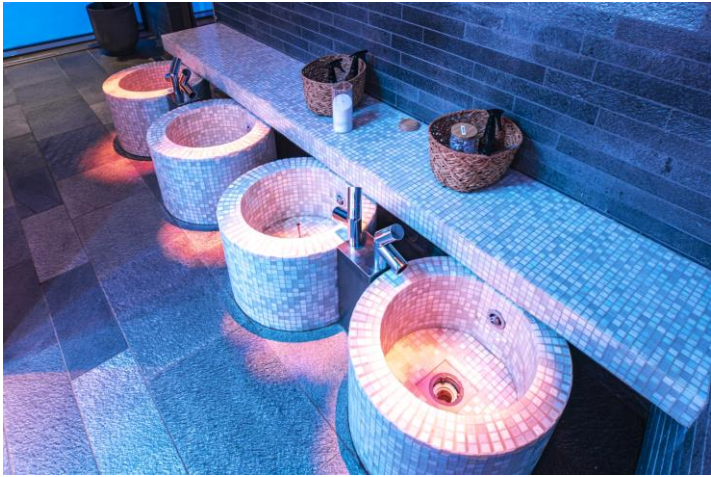
↔: Cape East - Hotel & SPA 酒店或同級